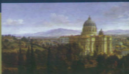
Caspar Andriaans Van Wittel Reprodução da obra The St Peter's in Rome - 1711